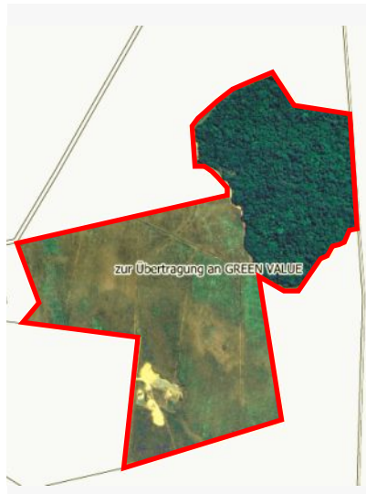
Übersichtskarte San Salvador