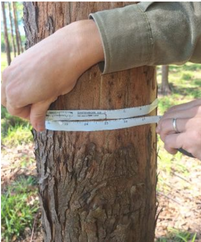
Forstinventar November 2025

Der Text ist ein Auszug des Video-Grußwortes zur Generalversammlung 2025, das Original befindet sich auf unserer Webseite www.green-value-sce.eu .