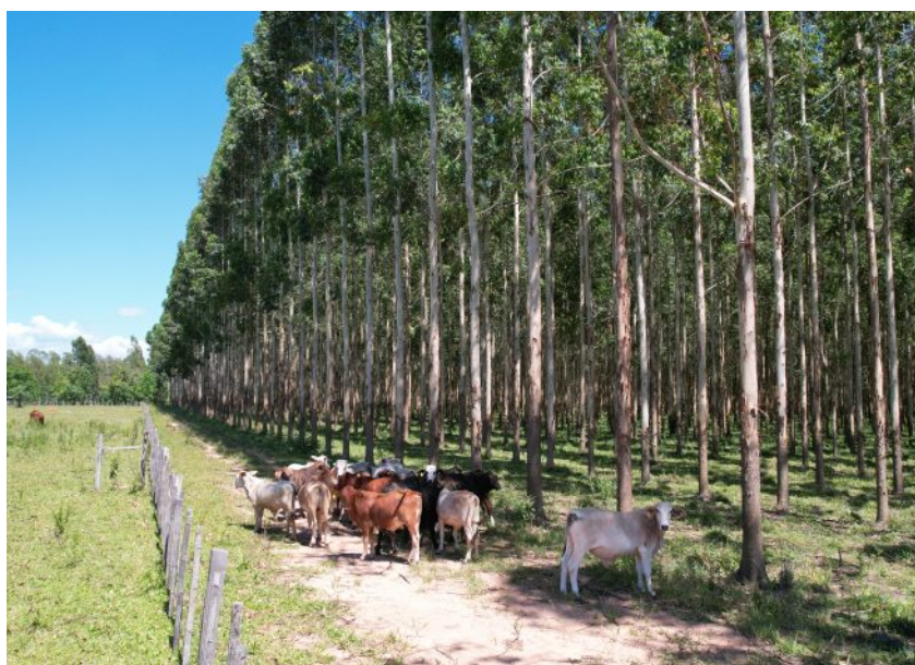
Rinderhaltung nach dem Waldweide-Prinzip