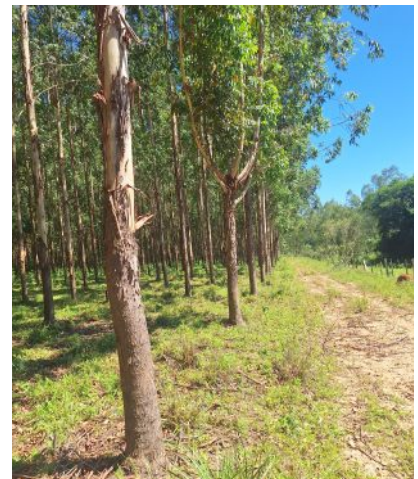
Anpflanzungen im November 2025