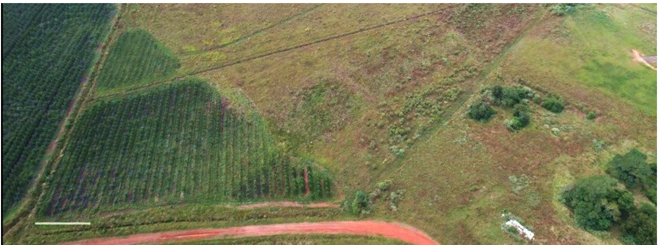
Luftbild San Salvador

Unsere Satzung und Kontakt zu uns finden Sie im Internet unter www.green-value-sce.eu oder Telefon +49(0)3681 7566-52 und per E-Mail an info@green-value-sce.eu .