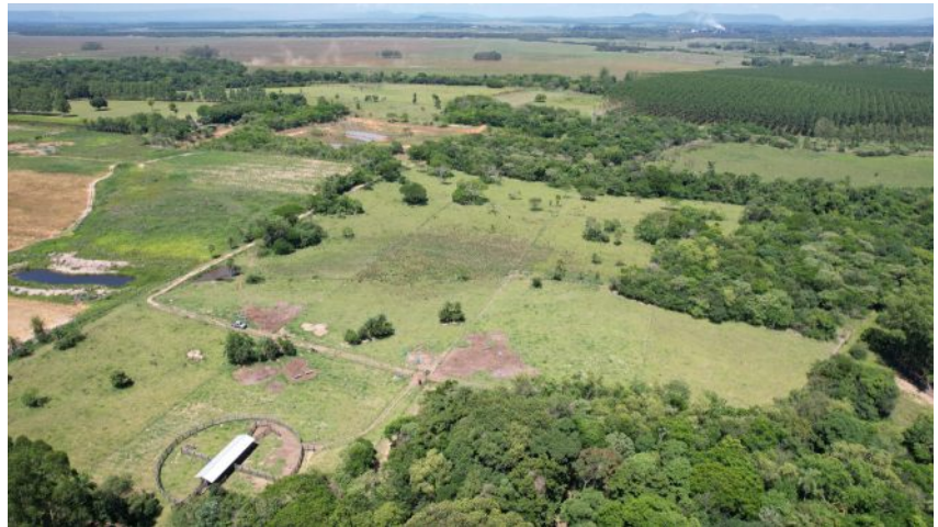
Gesamtansicht Coronel Martinez